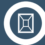
Bild: Wasserspeicher mit 6.000 m 3 Volumen, Verlegezeit der Folie ca. 1 Stunde

Die in einem Stück werkskonfektionierten Folien bieten Gewähr für Sicherheit und absolute Dichtheit.